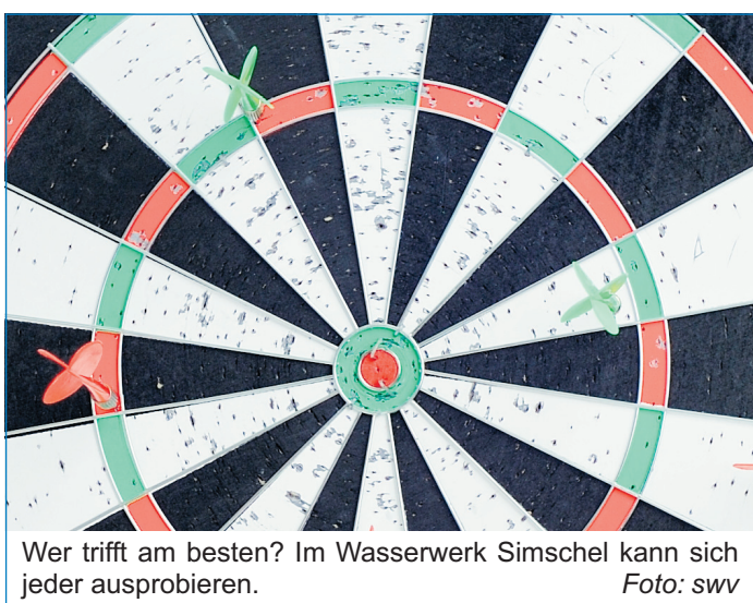
Wer trifft am besten? Im Wasserwerk Simschel kann sich jeder ausprobieren.

Wer Lust hat, eine Runde Dart in gemütlicher Atmosphäre zu spielen, der hat dazu am Freitag, dem 24. Oktober, Gelegenheit. Die Stadtwerke Völklingen veranstalten im Wasserwerk Simschel „Dart für jedermann“. Ob Laie oder Profi, Jung oder Alt: Jeder ist willkommen, denn Spaß und Geselligkeit stehen im Vordergrund. Ab 16 Uhr können sich Pfeilsportbegeisterte zum „Warm up“ treffen und ab 18 Uhr an der Simschelmesterschaft teilnehmen. Die Siegerinnen und Sieger werden mit Sachpreisen prämiert. Die Auto-